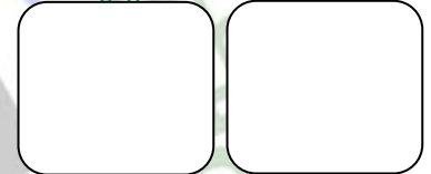
खातावाल ब्यक्तिको औठा छाप